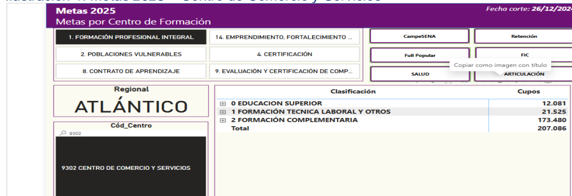
Ilustración 1. Metas 2025 – Centro de Comercio y Servicios